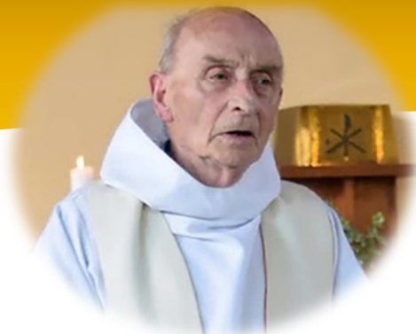
Le père Jacques Hamel Saint-Etienne-du-Rouvray